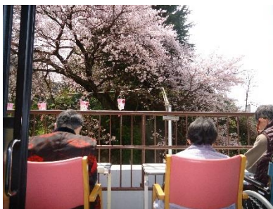
蓬萊園横の“桜”を愛でながらの食事