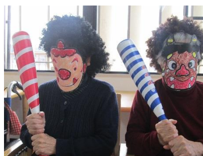
節分 私たちは誰でしょう？