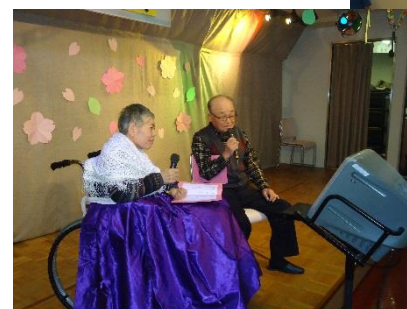
カラオケ大会 ご家族も参加されました。