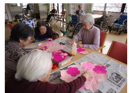
桜の貼り絵を作成中